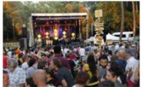
Un cadre idyllique pour un événement magique.

Sans aucun temps mort, et pendant plus de dix heures, les sept formations et les deux Dj ont distillé des musiques aux influences diverses et variées, allant du